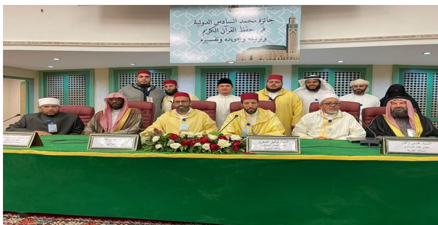
Gambar 2. Musabaqoh Tilawatil Qur'an (MTQ) International 2022

Gambar di atas menunjukkan bahwa eksistensi literasi Qur'an dengan menghafal sebagai tolak ukur keberhasilan nilai-nilai autentik yang masih terpelihara hingga saat ini. Terakhir, satu hal yang harus diingat berkenaan dengan dinamika tahfiz Al-Qur'an dari masa ke masa, yakni peran sentral seorang guru terhadap muridnya (para menghafal). Merekalah yang secara sosiologis menjaga otentisitas Al-Qur'an sekalipun mushaf atau peranti perekam Al-Qur'an berbeda-beda pada setiap masa. Dari ketersediaan peranti-peranti tersebut meghantarkan Al-Aur'an sebagai pilar keabadian dan petunjuk bagi umat selamanya. Autentifikasi ini yang kemudian menjadi daya tarik sendiri bagi Pondok Pesantren Yayasan Tarbiyatul Islamiyah untuk terus mengintegrasikan kesadaran dan penguatan santri bahwa dalam dirinya terdapat identitas muslim dari dirinya yang mampu menghadapi tantangan global dan ukhrawiyatnya.